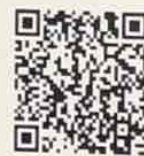
QR-Code ประกาศรับสมัคร