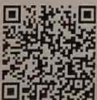
QR Code ใบสมัคร